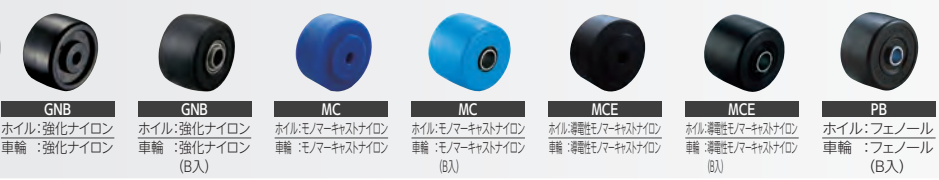
GNB ホイル:強化ナイロン 車輪:強化ナイロン GNB ホイル:強化ナイロン 車輪:強化ナイロン(B入) MC ホイル:モノマーキャストナイロン 車輪:モノマーキャストナイロン MC ホイル:モノマーキャストナイロン 車輪:モノマーキャストナイロン(B入) MCE ホイル:導電性モノマーキャストナイロン 車輪:導電性モノマーキャストナイロン MCE ホイル:導電性モノマーキャストナイロン 車輪:導電性モノマーキャストナイロン(B入) PB ホイル:フェノール 車輪:フェノール(B入)