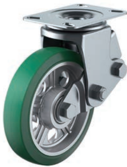
SKY-2S200AW (AR) Gr-A-1