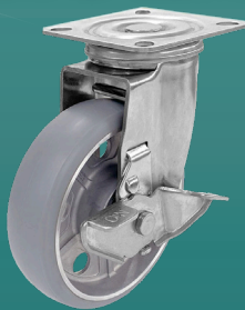
自在車ストッパー付