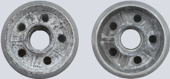
【通常アルミホイール車輪】 【高耐食性アルミホイール車輪】